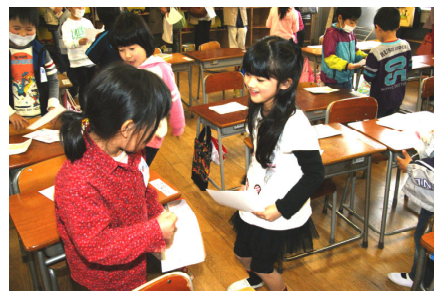
自分で作った名刺を交換して(1年生)

参観後に行われたPTA総会では、始めに校長から職員紹介をし、次いで1年間の学校運営計画や環境放射能への対応について説明をしました。PTA活動計画や新役員選出などを行い、PTA組織としても新年度を無事スタートすることができました。会の中では、多くの質問や意見が出され、今後の教育活